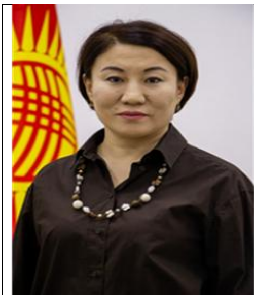
СЫДЫГАЛИЕВА НАЗГУЛЬ КУМАРБЕКОВНА Уполномоченный по вопросам предупреждения коррупции Министерства экономики и коммерции Кыргызской Республики